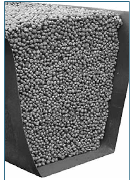
Fot. 3. Kruszywa sztuczne

Uformowaną masę granulki umieszczano w parownicach kwarcowych i spiekano