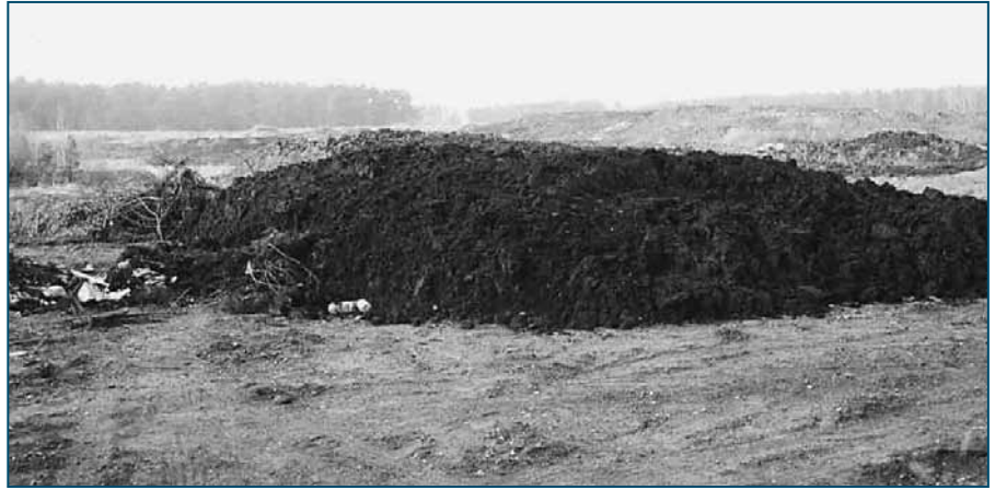
Fot. 2. Osady ściekowe

Założono, że stosunek wagowy surowców sypkich do osadów ściekowych musi umożliwić otrzymanie masy o gęstości pozwalającej formowanie mieszaniny do postaci granulatu.