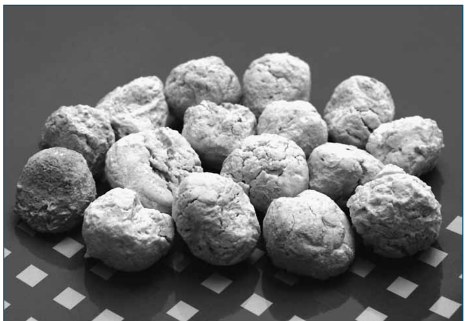
Fot. 4. Ziarna kruszyw